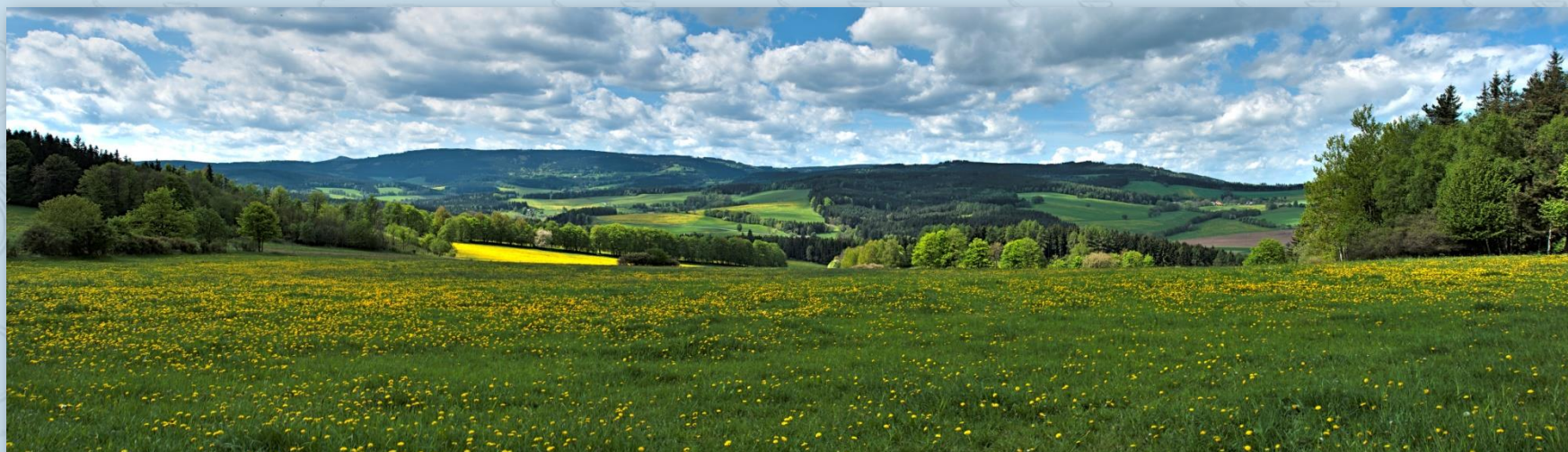
Krajina u Čachrova