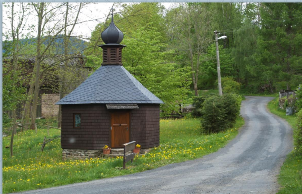
Kaple v Datelově

Další chalupy se stavěly v okolí tvrze a záměčku. První zmínka je z roku 1352. Původně byl sídlem rytířů z Čachrova a za husitských válek byl přičleněn k panství hradu Velhartice. Střídající se majitelé byli vesměs příslušníky drobné šlechty. Před I. světovou válkou náležel statek Čachrov jedné měšťanské rodině a měl rozlohu 694 ha. Roku 1904 byl Čachrov povýšen na městy.