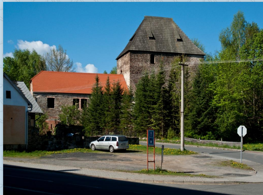
Čachrov - tvrz

V Děpolticích na návsi odbočíme vlevo na pěší turistickou trasu E6. Tato nenáročná cesta nás dovede až k hlavní silnici. Musíme však těsně za železničním přejezdem zatočit vlevo. Pak jedeme po kraji lesa a až se prostor poněkud otevře a objeví se oplocení, dáme se vlevo podél plotu. Tady opatrně, cesta příkře klesá a ústí přímo na již zmíněnou hlavní silnici. Tu přejedeme rovně, a dostaneme se tak na cestu do Staré Lhoty a po ní dále až do Nýrska.